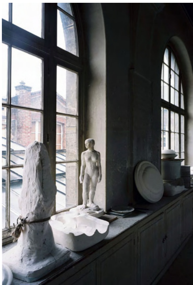
Atelier du grand coulage

Patrick Tournebœuf offre ainsi un regard personnel sur cette architecture industrielle du XIX e siècle et sur les traces perceptibles de l'activité humaine qui s'y déploie aujourd'hui encore. 130 céramistes produisent en effet chaque jour les objets de porcelaine de Sèvres selon les techniques du XVIII e siècle. Cette exposition est aussi une première incursion de la photographie dans les espaces habituellement réservés aux céramiques. Elle se déroule en parallèle à l'exposition Mise en œuvre, le quotidien et l'exceptionnel sous l'œil du design , du 1 er avril au 26 septembre 2011. Deux des tirages présentés intégreront les collections nationales de la Cité, au terme de cette manifestation.