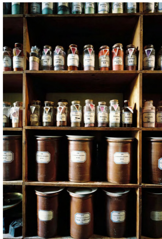
Salle des couleurs