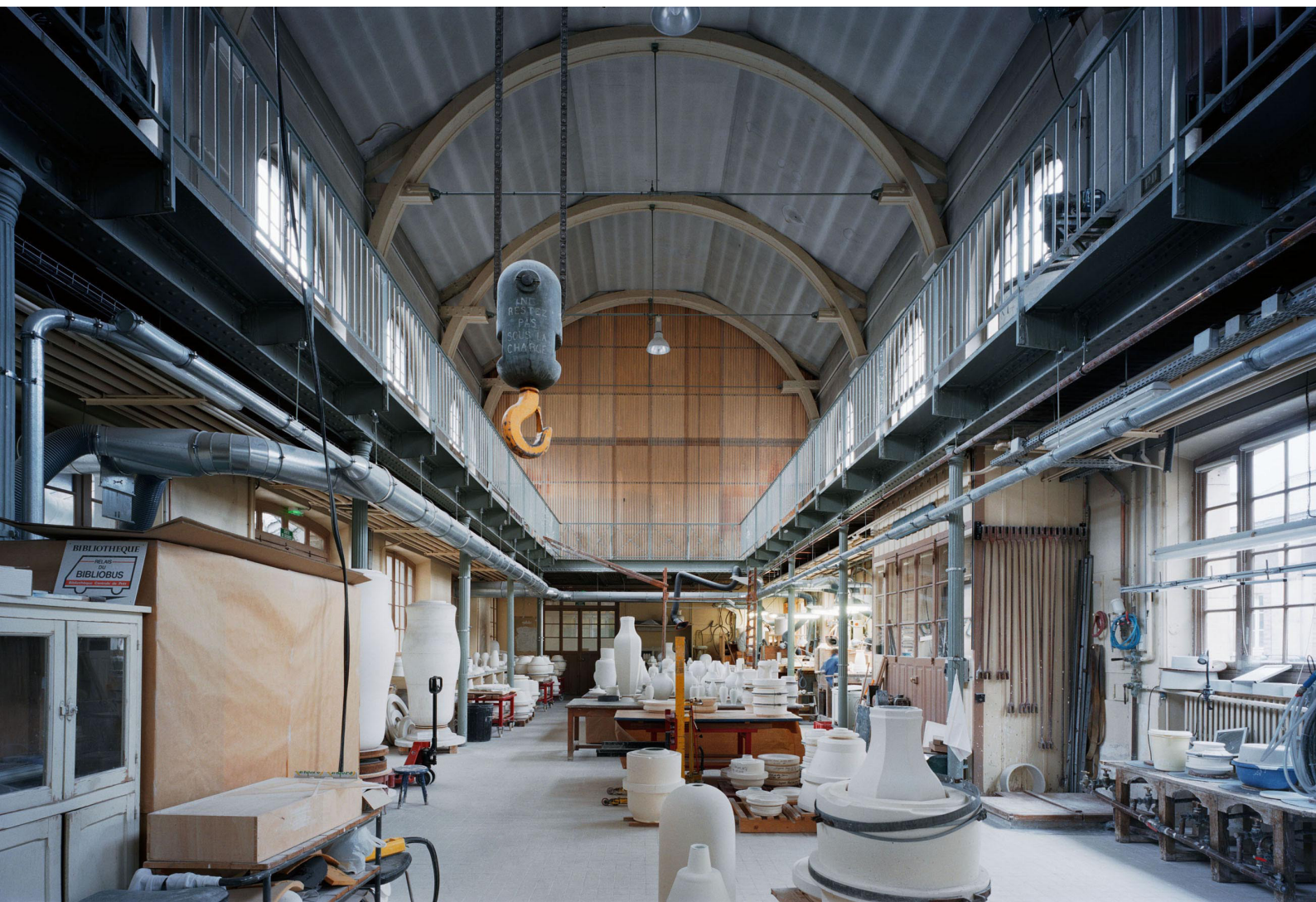
Atelier du grand coulage

Sèvres – Cité de la céramique, 2 place de la Manufacture 92310 Sèvres (Métro : Pont de Sèvres)