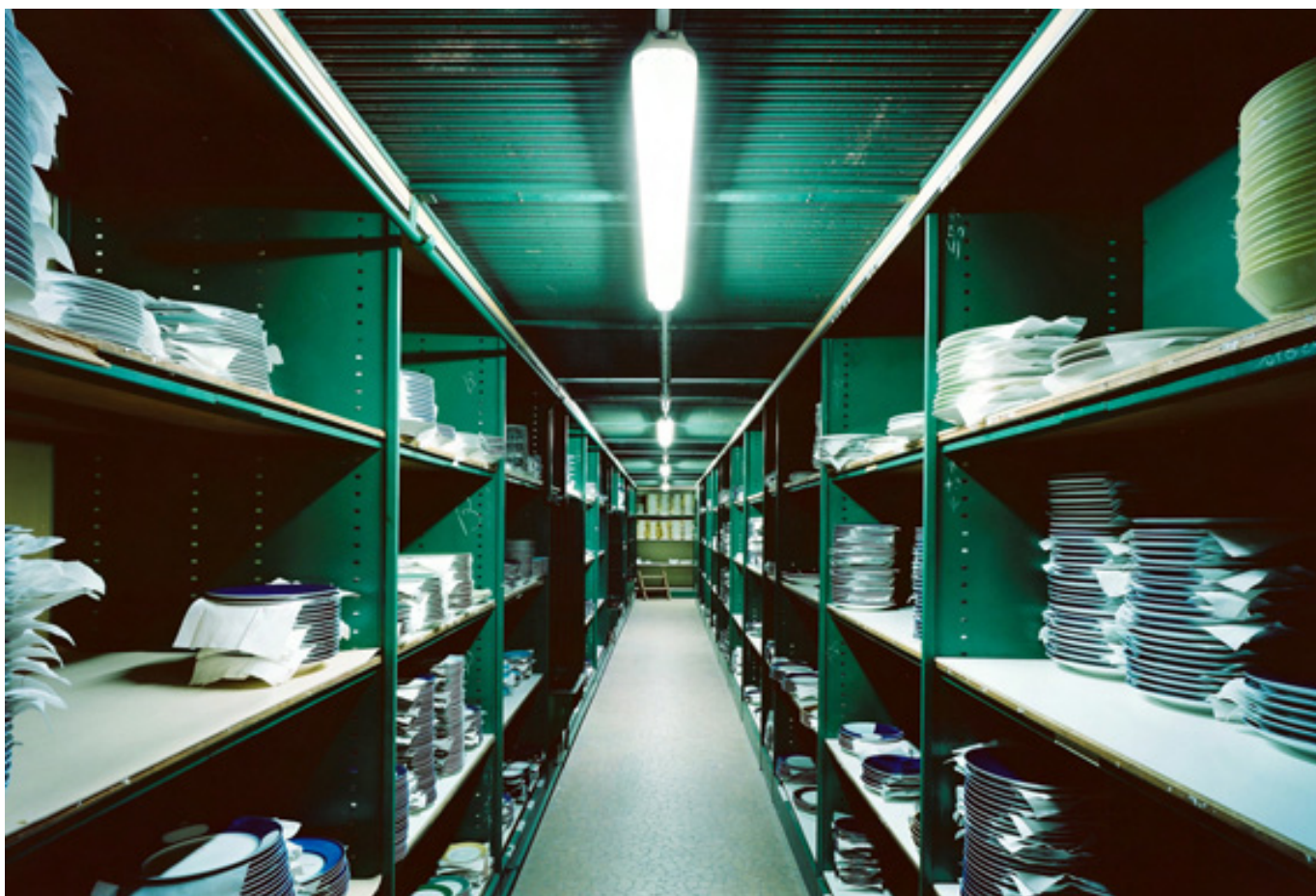
Magasin de blanc